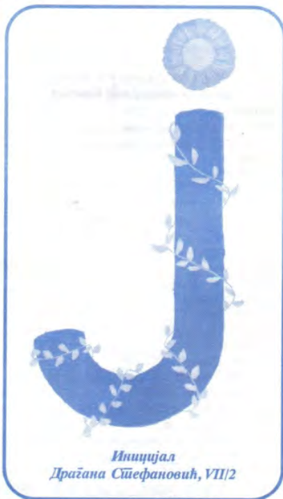
Иницијал Драѓана Стефановић, VII/2