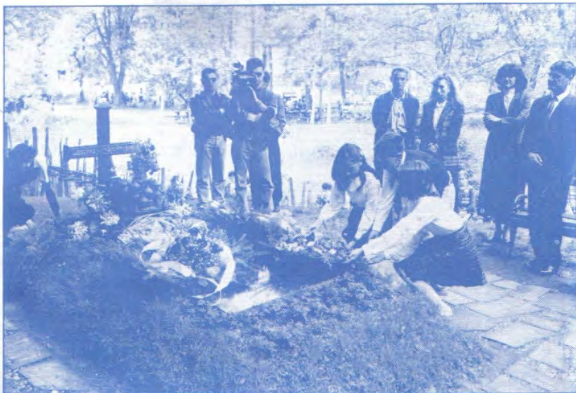
Бранковина - веници пошће на гробу Десанке Максимовић