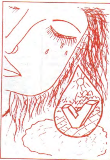
Ликовни прилоз: Ана Чолић VII/2

Овако компоно- вана, књига је тек први корак на међу- собном зближавању и упознавању. Наред- ни су: заједничка химна, израда спомен-