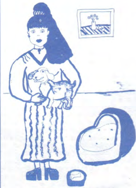
Ликовни ѝрилоѝ Сања Ђоновић, VI/2