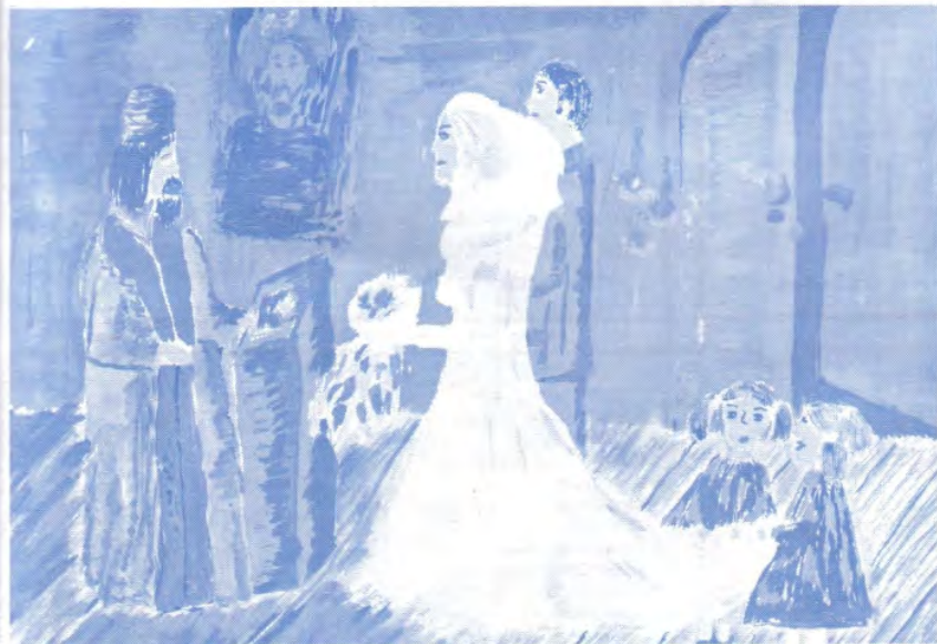
Венчање – Марија Марућ, VII/2