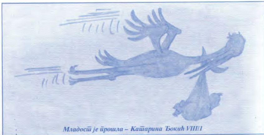
Младосѝѝ је ѝрошла – Каѝарина Ђокић VIII/1