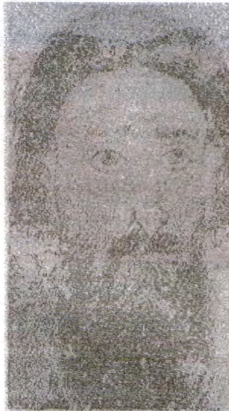
Свети Сава, икона из Милешева (13. век)