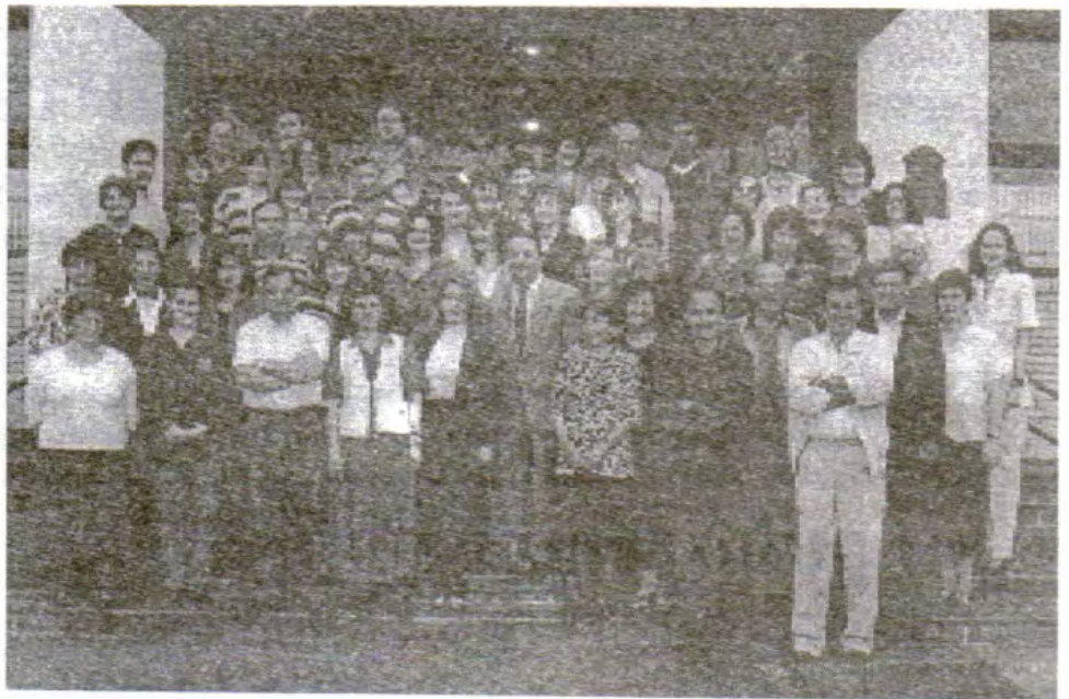
Они треба да дају решења на предлоге из сандучета - наставнички колектив