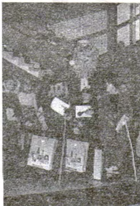
Деда Мраз на новогодишњем маскембалу у нашој школи