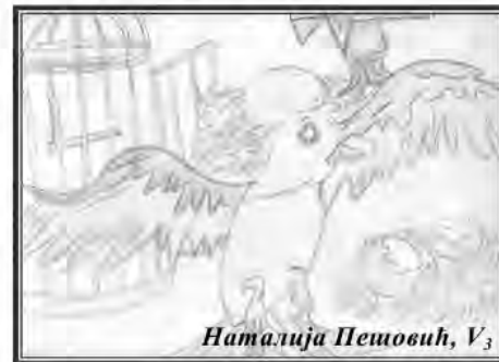
Наталија Петовић, V 3