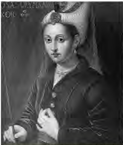
Хурем султанија, уље на платну (16. век)

Последње године Сулејмановог живота прошле су у суровим породичним сукобима и интригама у којима је предњачила Сулејманова омиљена супруга, Хурем султанија или Рокселана. Рокселана је била робинја пољско-украјинског порекла, кћерка украјинског попа коју су заробили Татари у Рутинији и продали на пијаци у Истанбулу. Право име јој је највероватније било Александра Лисовска. Врло брзо је постала омиљена султанова робинја, а потом и његова жена. Рокселана је Сулејману родила пет синова и једну кћерку: Мехмеда (1521), Мириму (1522), Абдулаха, Селима, Бајазита (између 1523. и 1526) и Џихангира (1531). Абдулах је умро као дете, 1526. године, у некој од епидемија које су напале харем, док је најстарији син, Мехмед, умро 1543. године у 21. години живота од богиња. Међутим, Сулејман је имао још једног сина, Мустафу, којег му је родила прва жена, Ђулбахар ( Gülbahar ) и према томе имао је првенство над Рокселаниним синовима. Осим тога, Мустафа је имао и подршку Ибрахим-паше, који је такође био један од