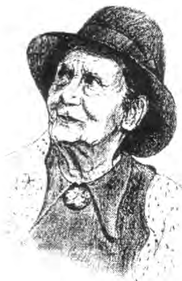
Десанка Максимовић (1898 - 1993)

Не мерим више време на сате, ни по сунчевом врелом ходу; дан ми је кад се његове очи врате, а ноћ кад поново од мене оду. Не мерим срећу смехом, ни тиме да ли је чежња моја од његове јача; срећа је мени кад болно ћутим с њиме, и кад нам срца бију ритмом плача. Није ми жао што ће живота воде однети и капљу мога живљења; сад нека младост и све нека оде; он је стао крај мене пун дивљења.