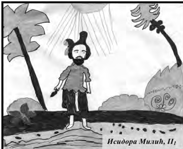
Исидора Милић, II 1