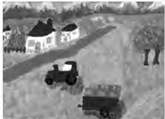
Марко Николић, VII 1