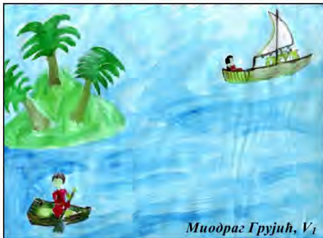
Миодраг Грујић, V 1

( Песма је награђена на конкурс у Црвеног крста)