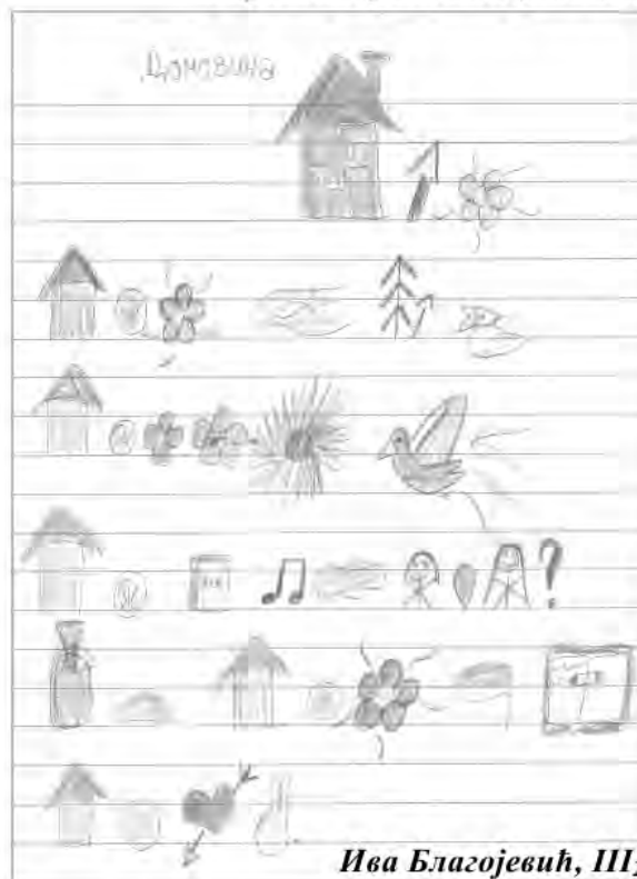
Ива Благојевић, III 2